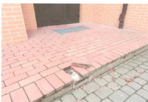
Luźne cegły w podeście