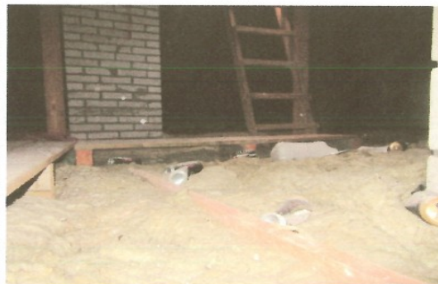
Zdeptana wełna przy wejściu