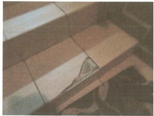
Uszkodzona płytką na schodach