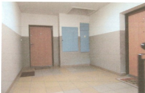
Wejście na strych