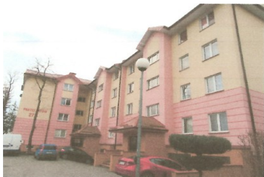
Elewacja 2 część prawa