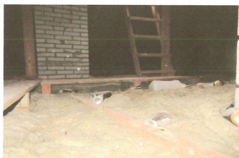
Zdeptana wełna przy wejściu