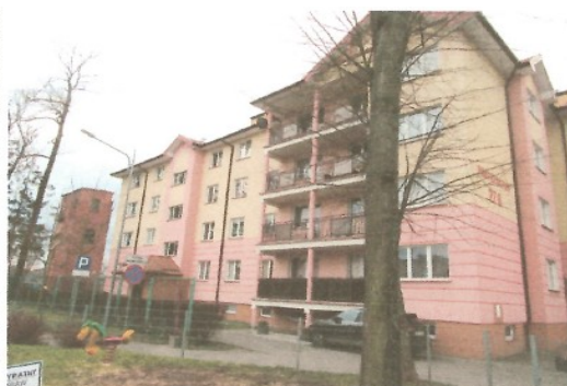
Elewacja 2 część lewa