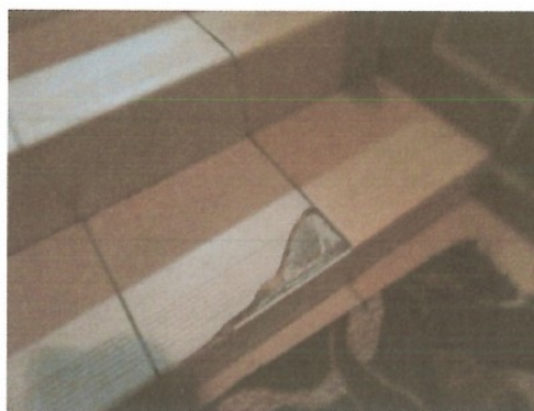
Uszkodzona płytką na schodach