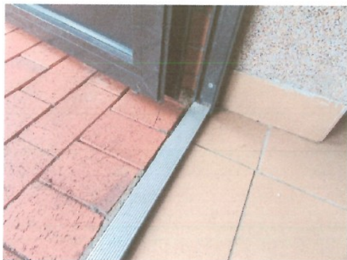
Luźne progi w drzwiach wejściowych