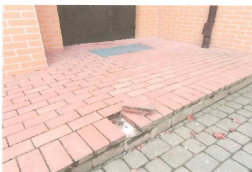
Luźne cegły w podeście