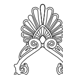
Elewacja frontowa i tylna