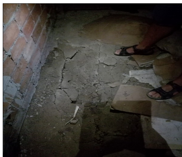
Fragment posadzki na korytarzu piwnicznym