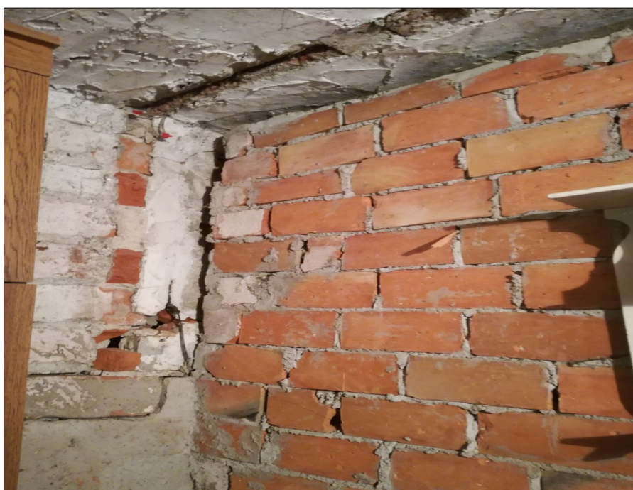
Fragment ściany w jednej z piwnic w budynku