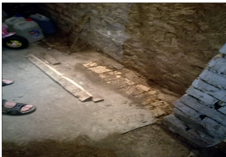
Fragment posadzki w jednej z piwnic