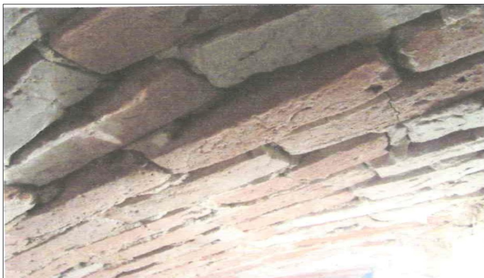
Fotografia obrazująca fragment stropu ceglanego.